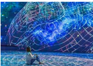
Жежү арал 📍