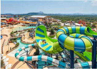
Жежү арал 📍