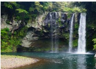
Жежү арал 📍